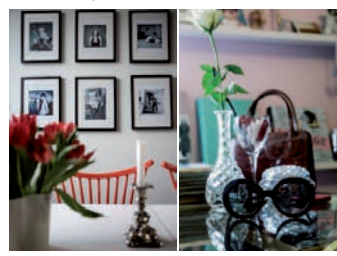
I köket sitter gamla testprintar från musiktidningen NME. De röda pinnstolarna kommer från Ikea. Glasen är loppisfynd.